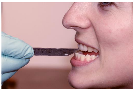
Patient die Bewegungen der maximalen Protrusion (100%) bei geöffneten Mund ohne Konstruktionsbiss ausführen lassen